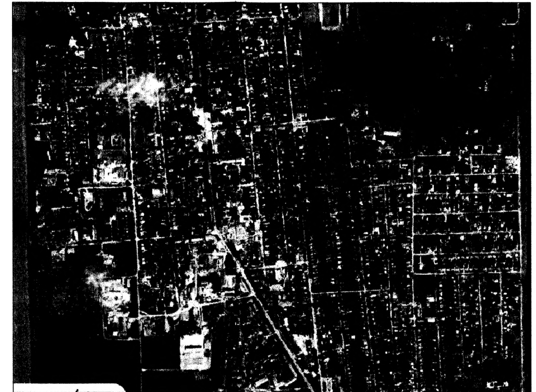
Месторасположение земельного участка